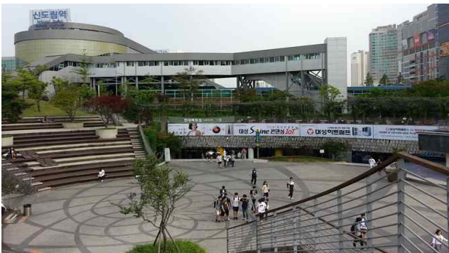
신도림역 디큐브시티 지하광장